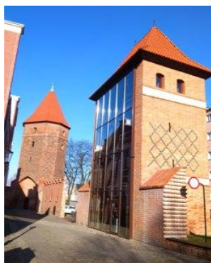
Fot. Mury obronne z basztami

Po wyjściu z kościoła koniecznie trzeba zobaczyć odrestaurowane miejskie mury obronne z XIV wieku, które zostały w ostatnich latach kompleksowo, wraz z 3 basztami, zrewitalizowane.