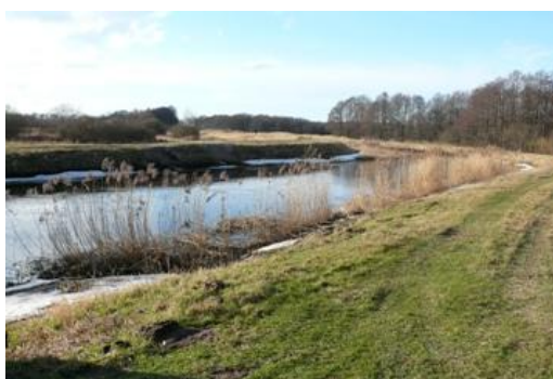
Fot. Rzeka Łeba

Gać – osada rybacka leżąca na terenie SPN. We wsi znajduje się dom z przełomu XIX/XX w nr 14, w którym są pokoje do wynajęcia. W sąsiedztwie wsi w kierunku północnym na Półwyspie Gackim znajduje się obszar ochrony ścisłej miejsc łęgowych ptactwa wodnego pn. „Gackie Łęgi”.