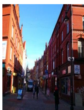
Fot. Ulica Staromiejska