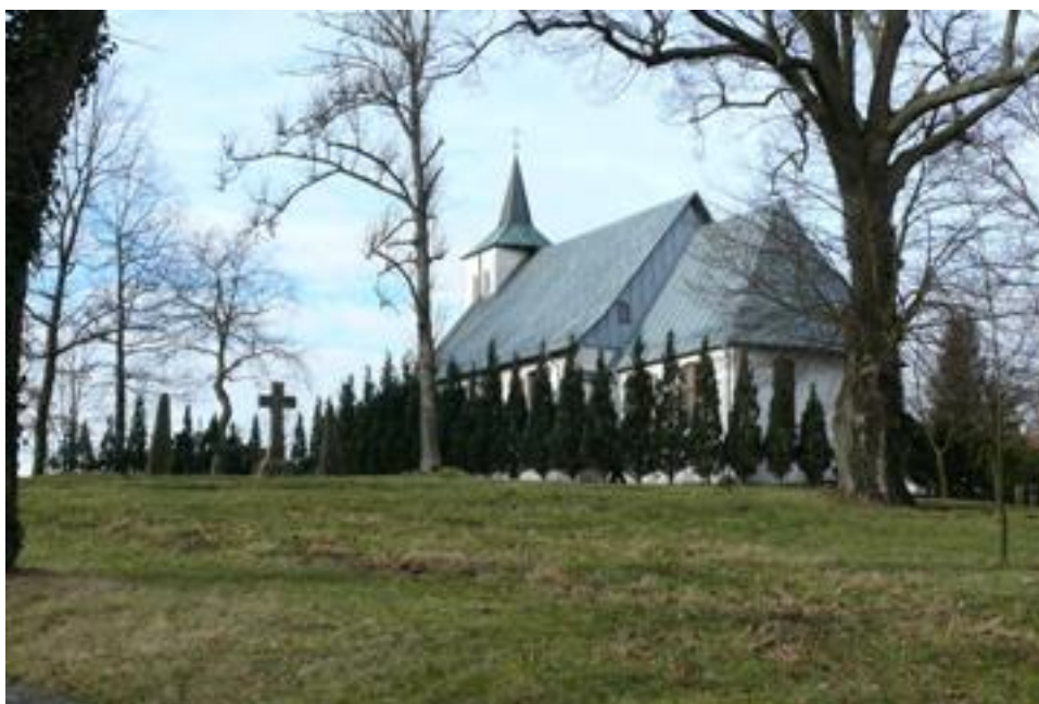
Fot. XVII-wieczny kościół w Charbrowie.