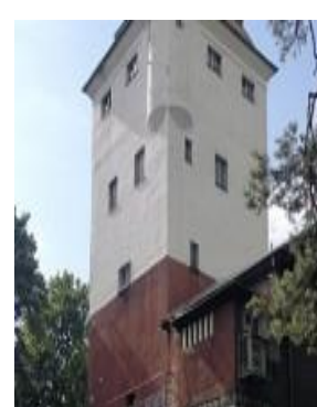
Fot. Wieża Ciśnień.