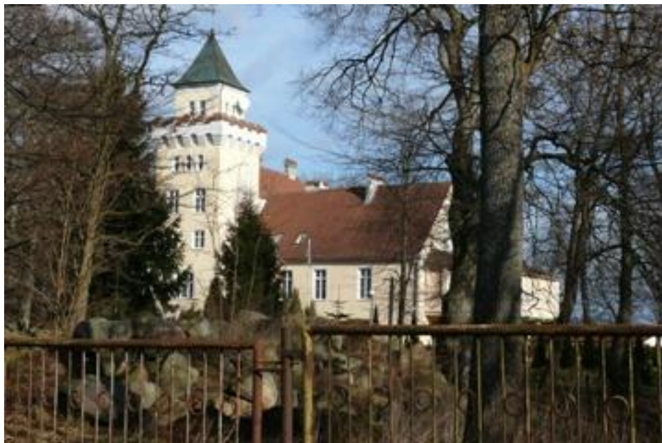
Fot. Kompleks restauracyjno-hotelowy w Nowęcinnie.

Obecnie w zamku znajduje się restauracja i hotel. Zaplecze gospodarskie od lat wykorzystywane jest jako stadnina koni z agroturystyką.