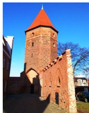
Fot. Baszta Bluszczowa z XIV w.

Wychodząc na wprost, z terenu przykościelnego, wchodzimy na ul. Młynarską, przy której w odległości około 100 m mieści się Muzeum. Dosłownie kilkadziesiąt kroków dalej, przy ul. Przyzamyce, stoi najważniejsza budowla średniowiecznego Lęborka – zamek krzyżacki zbudowany w latach 1341-1364. Został wzniesiony w stylu gotyckim na podstawie prostokąta, z narożnymi wieżami i kompleksem zabudowań obejmującym: spichlerz zbożowy, browar, piekarnia z przełomu XIV i XV wieku oraz do dzisiaj istniejące: młyn, dom młynarza i spichlerz solny z XVI wieku.