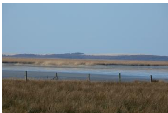
Fot. Jezioro Łebsko

Żarnowska - stara osada słowińska. W średniowieczu była stacją rybacką cysterek z Żarnowca (stąd nazwa). We wsi zachowały się budynki z przełomu XIX i XX w. Dzisiejsza Żarnowska, to wieś letniskowa położona nad jeziorem Łebsko na skraju Słowińskiego Parku Narodowego.