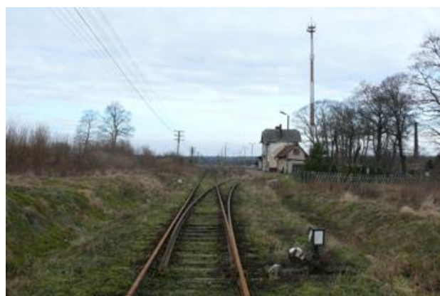
Fot. Dworzec kolejowy na trasie Lębork – Łeba.

Przez Łędziechowo przechodzimy krętą drogą w kierunku Gęsi ( 4,8 km ) niedużej wsi.