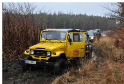
Fot. Impreza samochodów terenowych w Sylwestrową Noc w Łebie