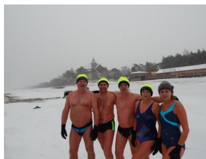
Fot. Morsy zimą na plaży w Łebie.