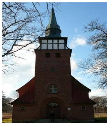
Fot. Kościół pw. Św. Józefa z 1904 roku.