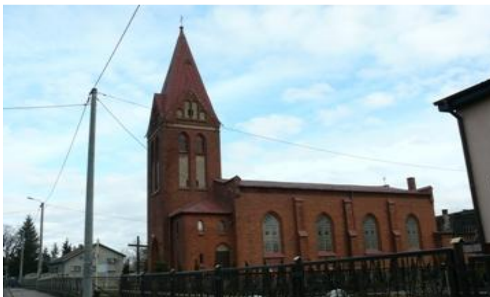
Fot. Neogotycki, orientowany kościół z 1882 roku w Łebieniu.

Z Łebienia ( 0,0 km ) wychodzimy drogą powiatową w kierunku wsi Łędziechowo( 2,3 km) położonej przy linii kolejowej Lębork –Łeba.