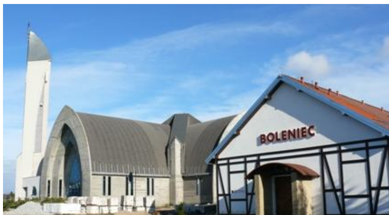
Fot. Kościół Świętego Jakuba Apostoła i Dom Pielgrzyma w Łebie

Łeba – podobnie jak Lębork należy do miejsc szczególnie związanych z kultem Św. Jakuba Apostoła. Tutaj bowiem znajduje się najdalej na północ położony kościół pod jego wezwaniem w Polsce. Tutaj także spoczywają relikwie świętego, a specyficzny klimat pielgrzymowania powoli nadaje charakter miejscowości.