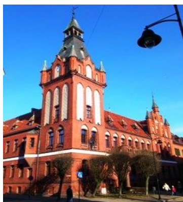
Fot. Ratusz miejski z 1900 r.

Inne, powstałe w późniejszym okresie, a zachowane budowle powstały już poza średniowiecznymi murami miasta. Największe wrażenie robią dwa budynki: Ratusz miejski w stylu neogotyckim, oddany do użytku w 1900 roku z reprezentacyjną Salą Rajców, gdzie obejrzeć można stuletnie witraże z herbami rodów szlacheckich ziemi lęborskiej oraz, również neogotycki, stojący naprzeciw ratusza budynek Poczty. Interesujący jest także pobliski budynek Miejskiej Biblioteki Publicznej, niegdyś willa należąca do lęborskiego przedsiębiorcy.