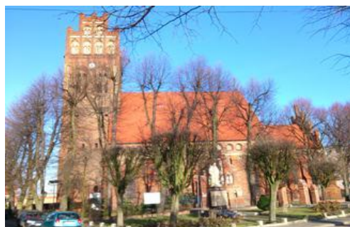
Fot. Sanktuarium św. Jakuba z XIV w.

Zimowe pielgrzymowanie należy rozpocząć w Lęborku od odwiedzenia Sanktuarium św. Jakuba Apostoła, jako jednego z najstarszych, a zarazem najcenniejszych zabytków, zachowanych niemal w niezmienionej formie. Znajdują się tutaj relikwie św. Jakuba Apostoła.