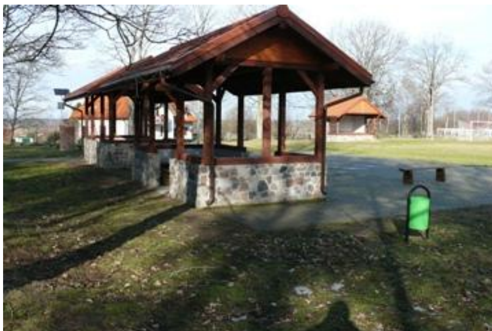
Fot. Miejsce odpoczynku dla turystów podczas zimowej wędrówki.

Przy cmentarzu znajduje się dogodne miejsce do odpoczynku przed dalszą zimową wędrówką.