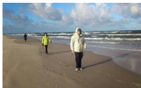
Fot. Zimowe Nordic Walking w Łebie.