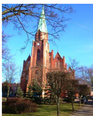
Fot. Kościół NMP