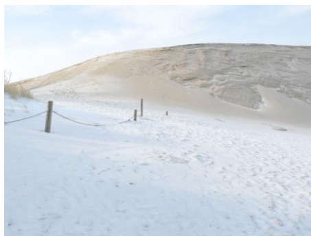
Fot. SPN - wydmy

Droga wiedzie nas teraz w odległości kilkaset metrów od południowych brzegów Jeziora Łebsko wśród borów i lasów mieszanych sosnowo-brzozowych, przez stare wydmy śródlądowe o wysokości do 24 m. Po ok. 3 km wędrówki znajdujemy oznakowane miejsce postoju i rozległy obszar wodno - błotny pn. Wielkie Bagno (11 km), z torfowiskami przejściowymi i wysokimi oraz borami i lasami wilgotnymi, w tym - z brzezinami bagiennymi, łęgami olszowo-jesionowymi i olsami. Jest to największe w Polsce miejsce jesiennych zlotowisk żurawi oraz ostoja niełęgowych ptaków i noclegownia dla stad żurawi przelotnych, również w okresie zimowo-wiosennym.