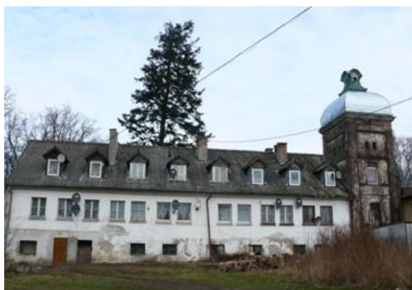
Fot. Pałac z drugiej połowy XIX wieku.

Łędziechowo – najstarsza wzmianka pisana pochodzi z 1224 roku i zawarta jest w poświadczeniu nadania wsi klasztorowi norbertanek z Żukowa. We wsi zachowały się fragmenty klasycystycznego pałacu z drugiej połowy XIX wieku. Wychodząc z miejscowości, po prawej stronie mijamy dworzec kolejowy na trasie Lębork – Łeba, który jest czynny tylko w okresie letnim.