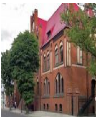
Fot. Budynek Poczty z 1905 r.