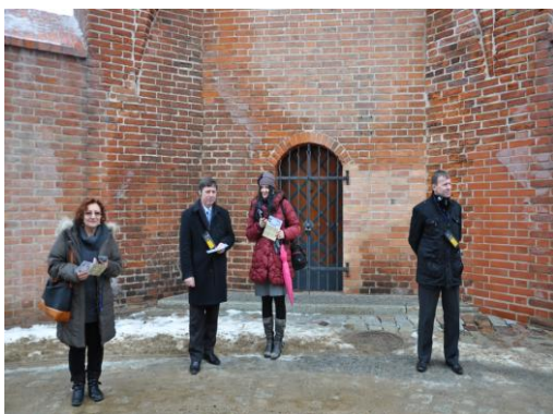
Fot. Zwiedzanie z audioprzewodnikiem

W zwiedzaniu Lęborka pomocne będą audioprzewodniki, dostępne w językach: polskim, angielskim, niemieckim, litewskim, które można nieodpłatnie wypożyczyć w lęborskim Muzeum. Po pełnym wrażeń dniu na nocleg w nowych i funkcjonalnych pokojach zaprasza Dom Pielgrzyma przy Sanktuarium św. Jakuba Ap.