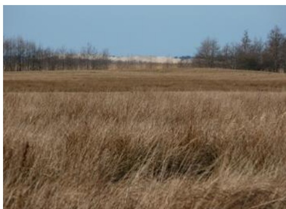
Fot. Jezioro Łebsko i wydmy

Izbica - miejsce naszej mety, stara wieś kaszubska z tradycją rybacką. Zachowały się tutaj: neogotycki kościół filialny pw. Św. Józefa z 1904 roku, park dworski z drzewami pomnikowymi, kilka budynków folwarcznych z XIX w i cmentarz ewangelicki.