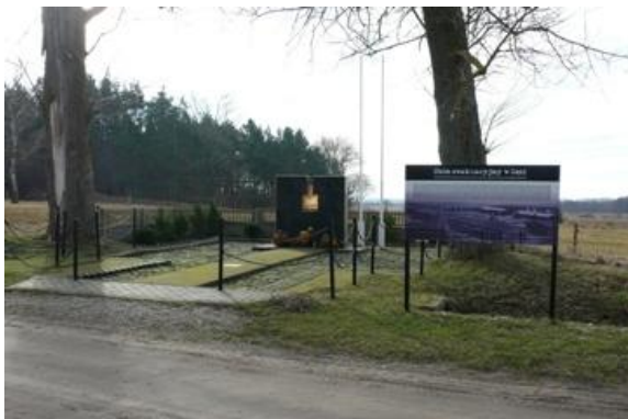
Fot. Pomnik Ofiar Marszu Śmierci w Gęsi.

których prochy przeniesiono na cmentarz w Kępnie Kaszubskiej. Dziś obecnie znajduje się tu Izba Pamięci Ofiar Marszu Śmierci.