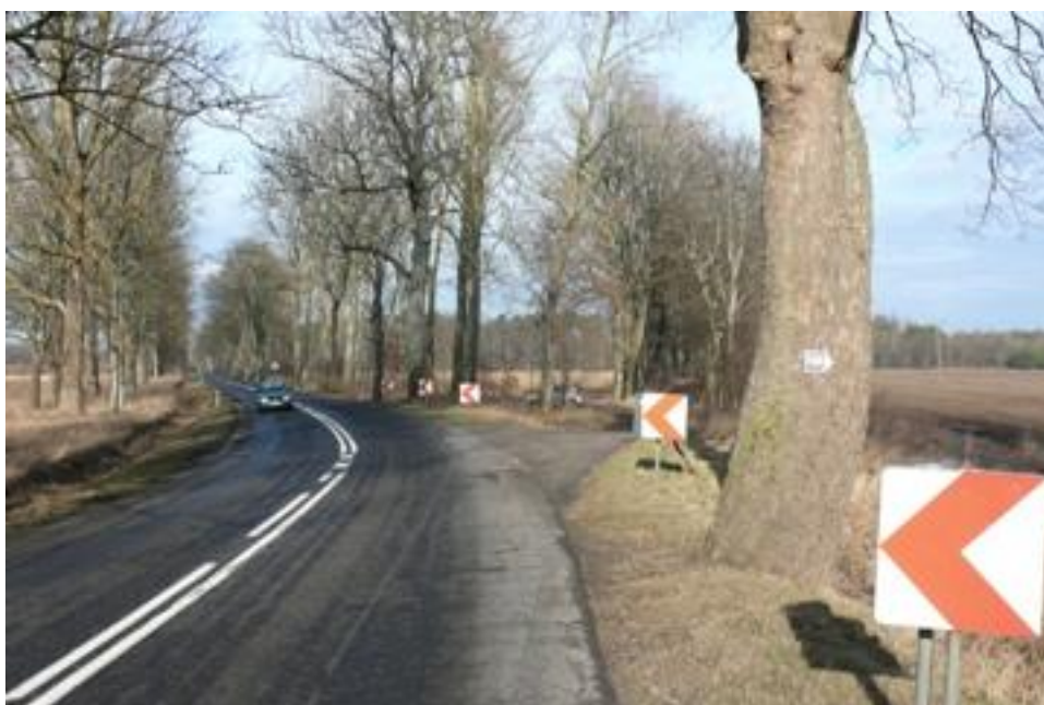
Fot. Szlak PDSJ, droga skracająca w prawo do Łebieńca.

Z Charbrowa wychodzimy początkowo drogą wojewódzką nr 214 wspinając się na wzgórze morenowe ( wysokość 37,2 m n.p.m. ) a następnie na rozwidleniu dróg ( 15,0 km ) schodzimy w polną drogę i od tego miejsca możemy korzystać ze sprzętu narciarskiego czy też z sanek . Droga do Łebieńca wiedzie drogą polną i lasem wzdłuż linii średniego napięcia i przez przejazd kolejowy ( 18,4 km ).